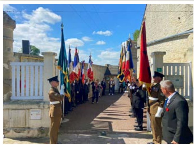
Haie d'honneur de nos porte-drapeaux pour l'accueil au vin d'honneur.