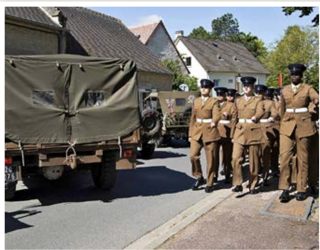
Arrivée de la troupe près des véhicules du site Hillman.