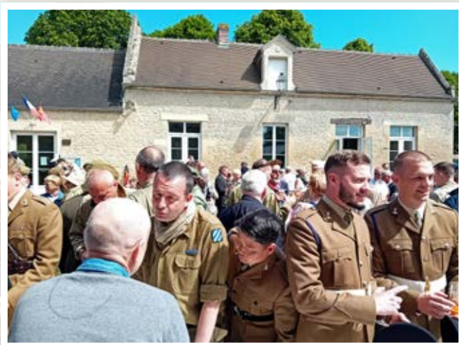
Le vin d'honneur : moment très convivial avec les soldats et le public.