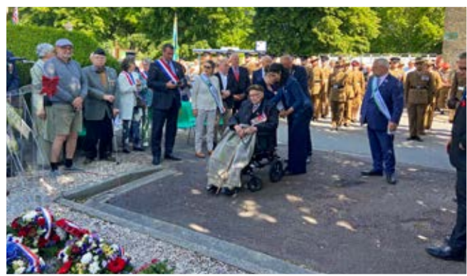
Présence de notre député, de nos conseillers départementaux, de nos maires voisins et d'un vétéran.