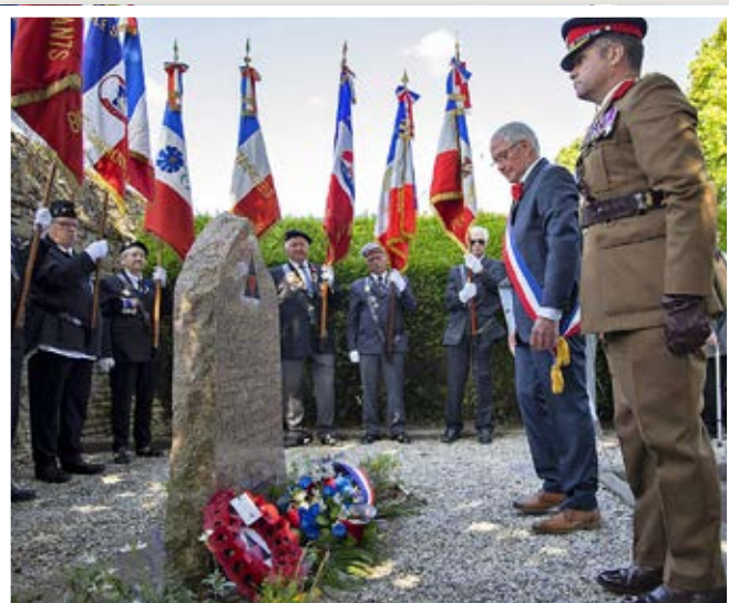
Dépôt de gerbe par le Maire et les représentants de la 3 e Division.