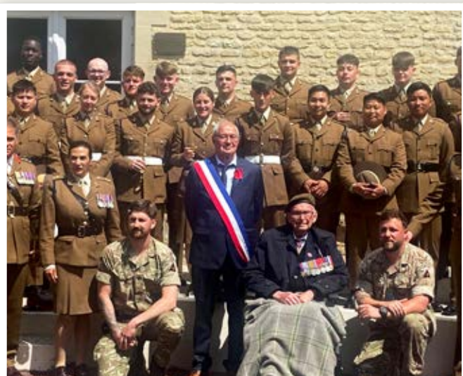
Photo souvenir avec la 3 e division, Le Maire, les officiers et notre vétéran !