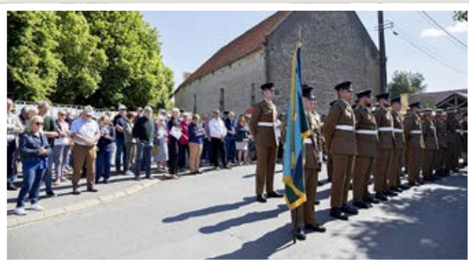
Le public et les Périersaines et Périersains venus nombreux.