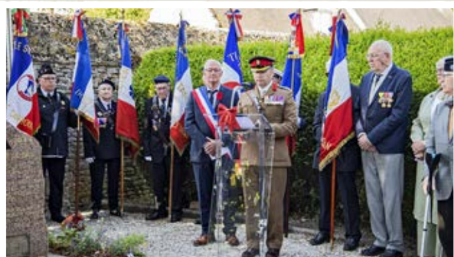
Les porte-drapeaux, Souvenirs de l'Orne et Souvenirs Français et lecture par l'officier britannique des noms des Soldats tués à Périers.