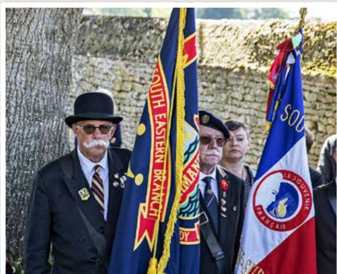
Photo souvenir avec nos Porte-drapeaux.