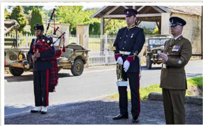
Les musiciens britanniques entonnent « Le Lament » devant les véhicules du site Hillman.